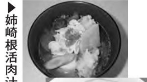
姉崎根活肉汁 いちはら一めん

11月10日(日)市原市の名産「姉崎だいこん」を活用したオリジナル料理を競うイベント「姉崎だいこんグルメ市原D-1グランプリ2013」が姉崎門前市と同時開催された。